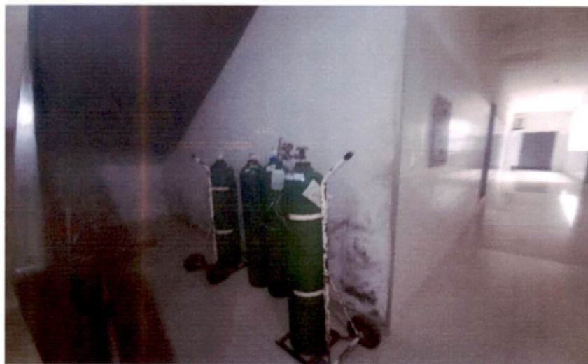
Não há oxigênio, ou outro gás medicinal canalizado. Armazenamento de cilindros em área insalubre, com superfícies comprometidas por umidade e fungos.