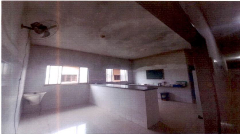
Posto de Enfermagem – sinais de abandono. Superfícies do forro e paredes muito comprometidos por extensas áreas com mofo/fungos e umidade,