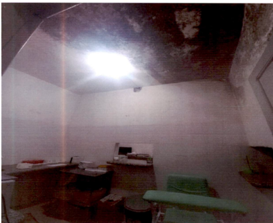
Laboratório de Análises Clínicas – sala de coleta com estrutura completamente comprometida por umidade e fungos no forro e paredes.