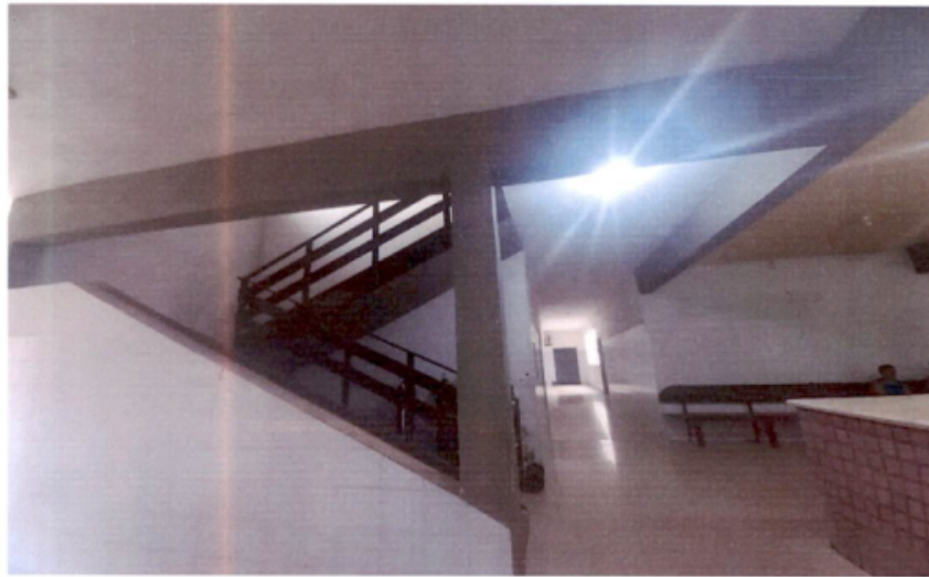
Escadaria que leva ao segundo piso, com todos os serviços desativados naquele andar, segundo informado.