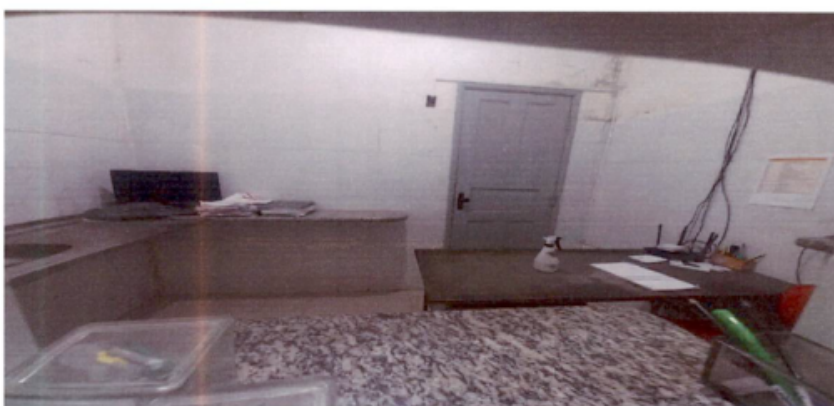
Postos de Enfermagem e Salas de procedimentos – superfícies de parede e forro comprometidas, mobiliário em madeira, material proscrito. Impressão de abandono.