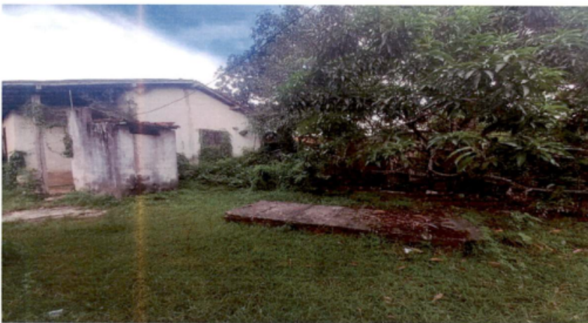
ÁREA EXTERNA – mato em toda a extensão.