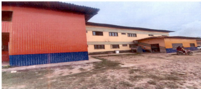
Acesso do hospital, dificultado. Máquina lavadora na entrada do hospital (sucata)

Todo a estrutura muito comprometida, em situação grave. Foi feito novo Auto de Infração e dado prazo de 60 dias para os aspectos relativos a estrutura física e 30 30 dias para os processos de trabalho. Feito Auto Prevista interdição parcial e ou total subseqüentemente, não havendo alteração para melhora da situação encontrada.