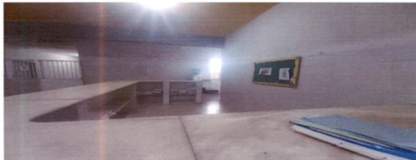
Recepção – ausência de funcionários no atendimento, ainda em horário vespertino.