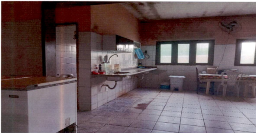
COZINHA – áreas de cocção e refeitório com toda a estrutura comprometida (piso, forro e paredes) por umidade, fungos e mofo. Sem condições de funcionamento.