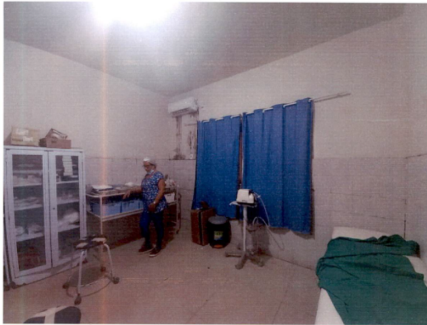
Salas de medicação e Procedimentos – mobiliário comprometido por oxidação. Estofamento danificado. Espuma exposta. Ausência de boas práticas.